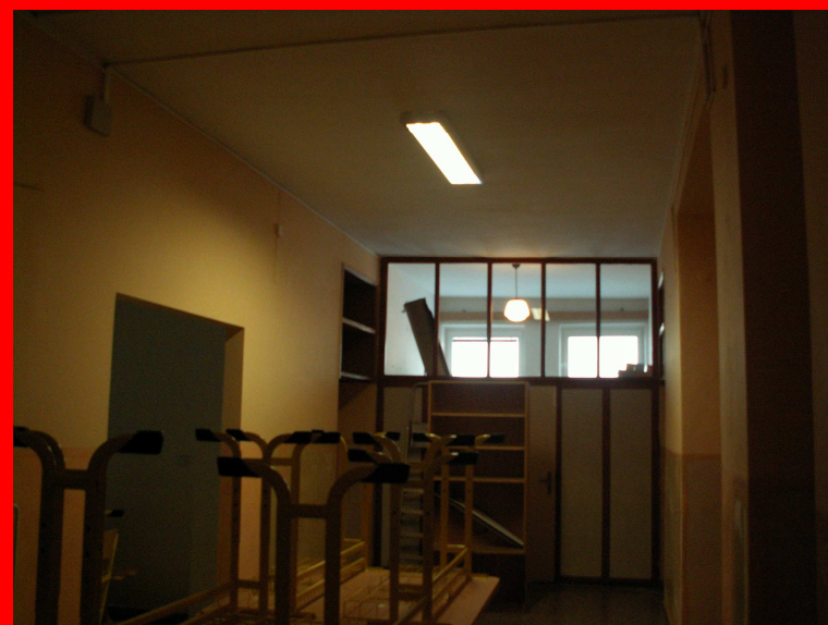
☛ chodba u školní družiny