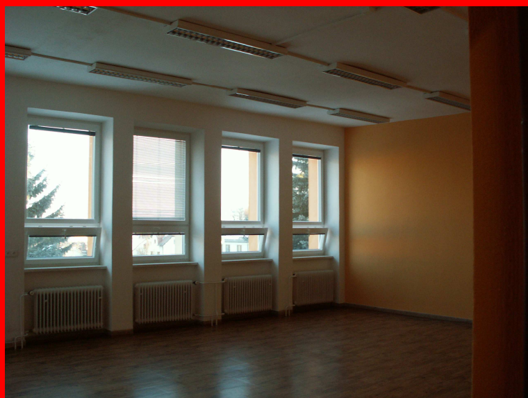
☛ školní družina oddělení II.